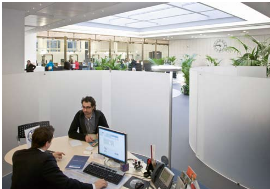
Die Finanzdienste der Banken machten 2008 mit 30% den grössten Teil der Dienstleistungsexporte aus. Bei den Dienstleistungsimporten haben die Lizenzen und Patente den Tourismus als wichtigste Kategorie abgelöst.

Für die Schweiz als kleine und offene Volkswirtschaft ist der Dienstleistungshandel mit dem Ausland wichtig. Er ist Teil des Aussenbeitrags (Exporte abzüglich Importe) und fliesst in die Berechnung des Bruttoinlandsprodukts (BIP) ein. Als Konjunkturindikator findet er vor allem als gleich- oder nachlaufender Indikator Verwendung. Die Statistik des Dienstleistungshandels der Schweiz mit dem Ausland ist eine Komponente der Zahlungsbilanz der Schweiz und wird von der Schweizerischen Nationalbank (SNB) vierteljährlich erstellt und veröffentlicht. Gegenwärtig baut die SNB die Erhebung der Statistik aus.