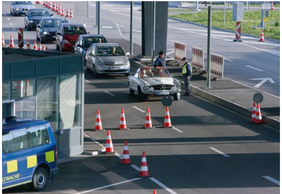
Im Vergleich zu anderen OECD-Ländern funktioniert die Integration der Zuwanderer im schweizerischen Arbeitsmarkt recht gut. Bezüglich der Beschäftigungsquote liegt die Schweiz über dem OECD-Durchschnitt und bezüglich Arbeitslosenquote darunter. Ein grosser Teil der Zuwanderer stammen denn auch aus dem EWR-Raum. Im Bild: Zoll von Rheinfelden.

Während langer Zeit gehörte die Integration von Zuwanderern nicht zu den Hauptsorgen der Schweizer Behörden. Solange die Migration aus Beschäftigungsgründen – begleitet von einem mehr oder weniger zeitversetzt stattfindenden Familiennachzug – vorherrschend war, schien die Integration der Zuwanderer und ihrer Nachkommen auf dem Arbeitsmarkt eine weniger grosse Herausforderung zu sein als der makroökonomische Einfluss auf die Löhne und den Strukturwandel. 3 In den letzten 20 Jahren haben sich jedoch die Migrationsströme diversifiziert – vor allem im Zusammenhang mit der humanitären Migration aus Ex-Jugoslawien und weiter entfernten Ländern. Diese Diversifizierung, der vermehrte Zuzug aus anderen Motiven als der Arbeitssuche und die Abschwächung des Wirtschaftswachstums sind Gründe, weshalb die Integration von Zuwanderern in der öffentlichen Debatte an Bedeutung gewonnen hat. Die Schweizer Behörden haben in diesem Kontext beschlossen, der Integration einen grösseren politischen Stellenwert einzuräumen.