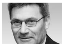
NR Dr. Pirmin Schwander Präsident der Aktion für eine unabhängige und neutrale Schweiz (Auns)