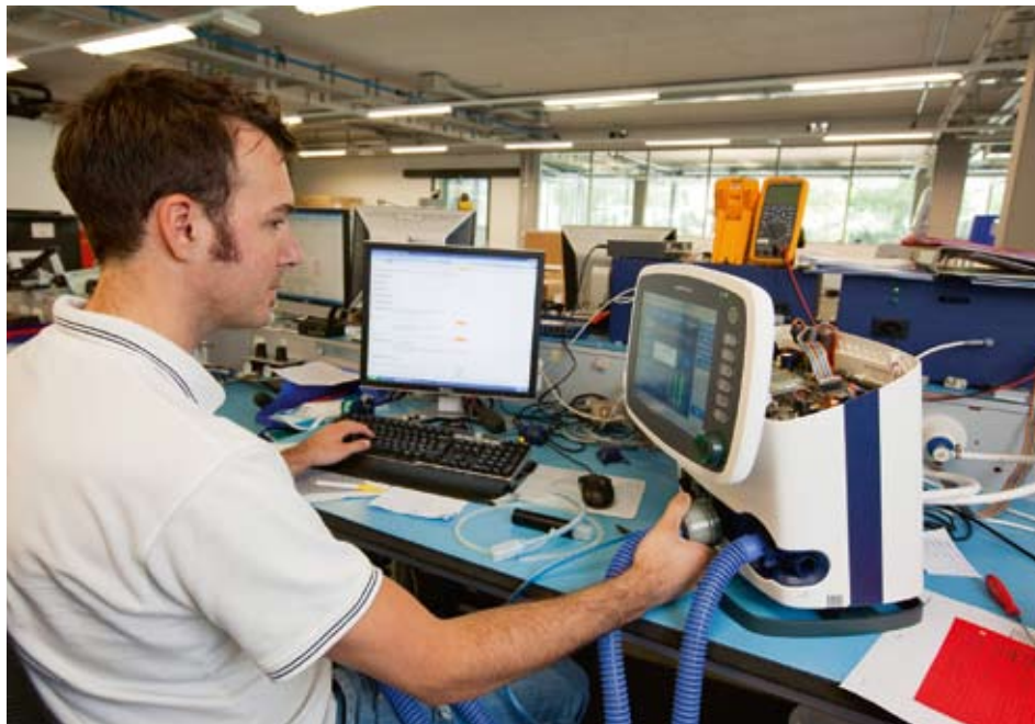
Die schweizerische Volkswirtschaft profitierte von den bilateralen Abkommen, indem sie die benötigten Arbeitskräfte für die vielen neu geschaffenen Arbeitsplätze importieren konnte – insbesondere in den Branchen mit hohen Qualifikationsanforderungen, aber auch in den personenbezogenen Dienstleistungen und im Baugewerbe.