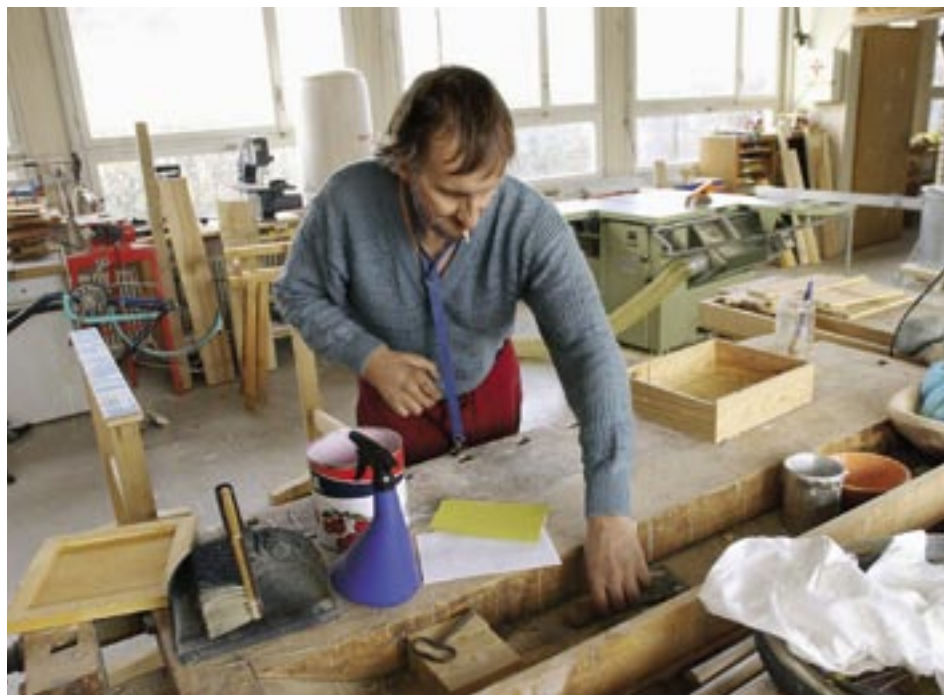
Wenn arbeitsmarktliche Massnahmen auf der individuellen Ebene Wirkung zeigen, heisst das nicht, dass auch die Arbeitslosigkeit zurückgeht. Von den untersuchten AMM zeigt einzig die vorübergehende Beschäftigung eindeutig die beabsichtigte Wirkung der Reduktion der Stellensuchendenquote.

Wie beeinflussen die arbeitsmarktlichen Massnahmen (AMM) die Stellensuchendenquote? Diese Frage wurde mittels eines ökonomischen Modells erstmals für die Schweiz untersucht. Die Ergebnisse deuten darauf hin, dass vor allem vorübergehende Beschäftigung hilft, die Zahl der Stellensuchenden zu reduzieren. Wie bereits in vergleichbaren Studien für andere Länder festgestellt wurde, ist der empirisch nachweisbare Zusammenhang zwischen den AMM und der Quote der Stellensuchenden schwach. Die Konjunktur hat einen ungleich stärkeren Einfluss auf die Zahl der Stellensuchenden.