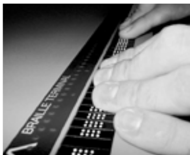
«Ein Blinder liest den Bildschirminhalt mit einer Brailleschriftzeile, die unterhalb der Tastatur platziert wird.» ( www.zugang-fuer-alle.ch )

Damit wird das vom Herausgeber und Webdienstleister gemeinsam getragene Projekt zu einem wichtigen Benchmark für weitere Websites.