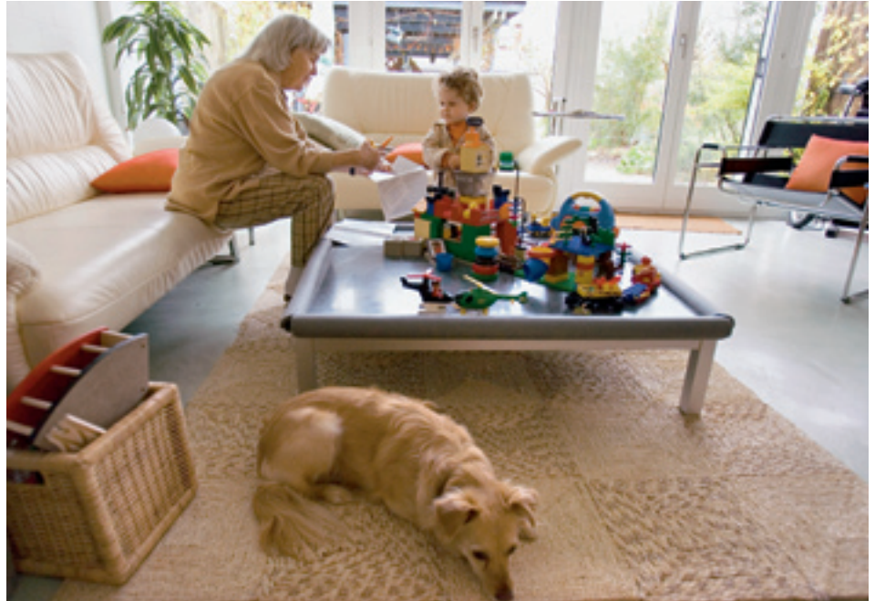
Für die Mütter von Kindern unter 15 Jahren ist die private Betreuung (etwa durch die Grossmutter) mit Abstand die wichtigste Betreuungsart. Allerdings steigt die Bedeutung der externen Betreuungsarten, je mehr die Mutter erwerbstätig ist.