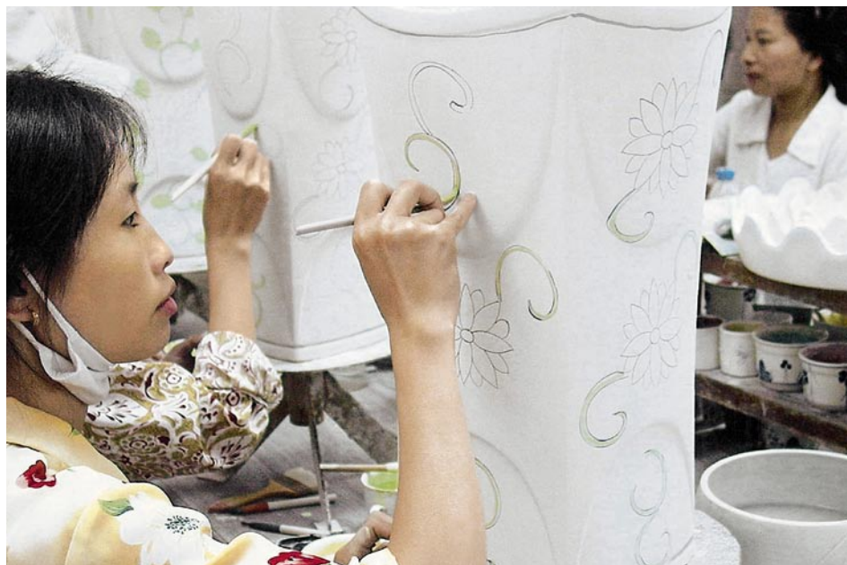
Die Entwicklung der Schwerpunktländer, die vom Seco unterstützt werden, bleibt trotz unverkennbarer Fortschritte fragil. Um die verbleibenden Herausforderungen bewältigen zu können, sind sie weiterhin auf externe Unterstützung im Wirtschafts- und Handelsbereich angewiesen. Im Bild: Textilfabrik in Vietnam.

Die Botschaft des Bundesrates für die wirtschaftliche Entwicklungszusammenarbeit bringt eine verstärkte thematische Fokussierung und eine neue geografische Schwerpunktsetzung für den bilateralen Teil dieser entwicklungspolitischen Massnahmen. Damit wird sichergestellt, dass die Hilfe weiterhin effizient und wirksam eingesetzt werden kann und im internationalen Kontext einen Mehrwert schafft. Mit dem Rahmenkredit von 800 Mio. Franken soll das Staatssekretariat für Wirtschaft (Seco) die wirtschafts- und handelspolitischen Aktivitäten der Schweiz im Rahmen der Entwicklungszusammenarbeit bis Ende 2012 weiterführen und einen dauerhaften Beitrag zur Verminderung der Armut leisten können.