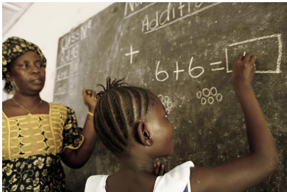
In den Staaten südlich der Sahara erzielte die westliche Entwicklungshilfe trotz der reichlich fließenden Mittel bisher nur bescheidene Erfolge. Ziel der Pariser Erklärung ist deshalb, die Wirksamkeit der EZA in Ländern wie Sierra Leone (im Bild) gezielt zu verbessern.

Die internationale Gemeinschaft und insbesondere die im Rahmen der OECD organisierten westlichen Geberstaaten sind gegenwärtig damit befasst, die Erklärung von Paris über die Wirksamkeit der Entwicklungszusammenarbeit (Pariser Erklärung) vom März 2005 umzusetzen. Die Pariser Erklärung ist der bisherige Höhepunkt einer mehrjährigen Entwicklung, die das Thema Wirksamkeit der EZA schrittweise als zentralen Fokus in der internationalen Entwicklungskooperation etablierte. Sie ist ein geeigneter Anlass, das Thema der Wirksamkeit von EZA über die OECD hinaus zu einer Kernfrage der internationalen Gemeinschaft zu machen, um Fragen der globalen nachhaltigen Entwicklung erfolgreich zu bewältigen. Der Gipfel in Accra im September 2008 wird zeigen, wie weit die Umsetzung der Pariser Erklärung seitens der Unterzeichner mittlerweile fortgeschritten ist.